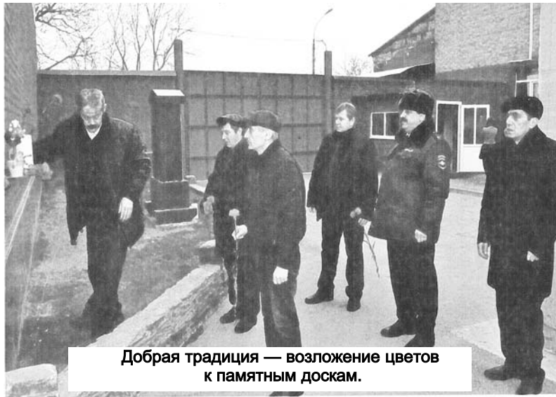
Добрая традиция — возложение цветов к памятным доскам.

Завтра в России, в странах СНГ, в соседних государствах будут проходить памятные мероприятия, посвященные 30-летию вывода советских войск из Афганистана. Для многих людей нашей страны и республики — это День памяти воинов-интернационалистов. В этот день в наших семьях, на встречах ветеранов боевых действий вспоминают события афганской войны и скорбят по погибшим, отдавая дань мужеству и героизму советских солдат.