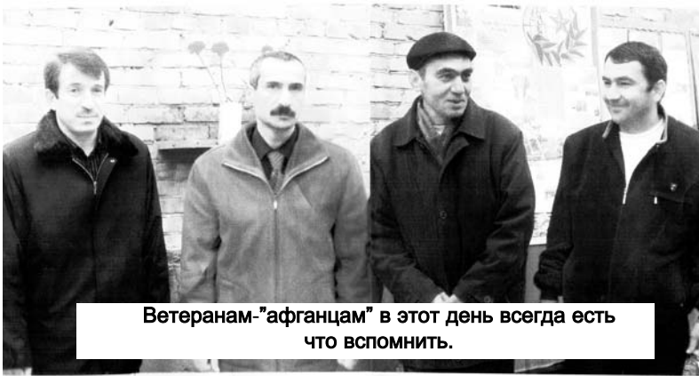
Ветеранам-"афганцам" в этот день всегда есть что вспомнить.

Когда наши войска, после того, как 27 декабря 1979 года спецназом СССР был осуществлен штурм дворца Амина, пересекли границу Афганистана, у нас была уверенность в том, что мы несем цивилизацию и социализм средневековой стране, идем спасать Афганскую революцию и защищать бедняков. У нас было великое искушение поддержать мировую социалистическую идею в